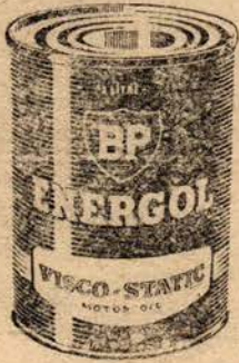
BP Energol "Visco-Static"

Arabanızdan daha iyi randıman almak için